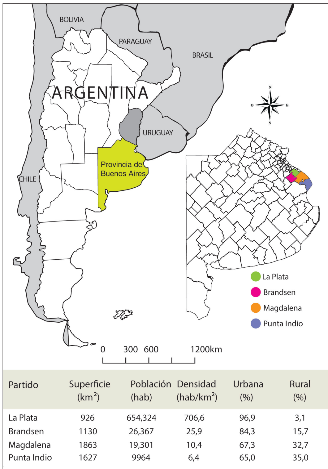
Fig.1. Ubicación geográfica y datos poblacionales de los partidos de La Plata, Brandsen, Magdalena y Punta Indio (Buenos Aires, Argentina).